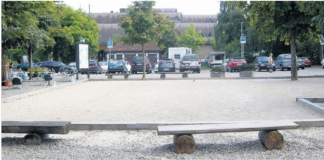
FESTGELÄNDE Der im Jahr 2011 neu gestaltete Wuhrplatz mit der Pétanque-Anlage wird ein zentraler Punkt bei den Feierlichkeiten 1150 Jahre Langenthal sein.